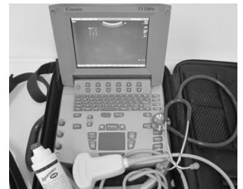
図1 当院でAUSに使用している SonoSite TiTAN

検案時にAUSを行い、その所見から死因が導かれた主な症例は、疑い例を含む大動脈解離72例、慢性心不全40例、肝硬変・肝不全12例、肝がん・転移性肝がんなどの悪性疾患死12例、その他3例で、総計136例であった。41%においてAUSが死因の根拠となる所見を示した(表1)。