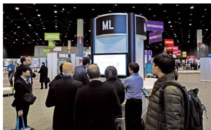
新設されたMachine Learning Community