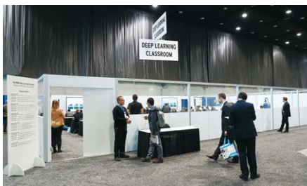
エヌビディアが提供するDeep Learning Classroom