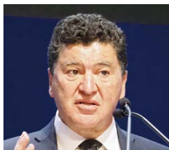
Elias A. Zerhouni, M.D.