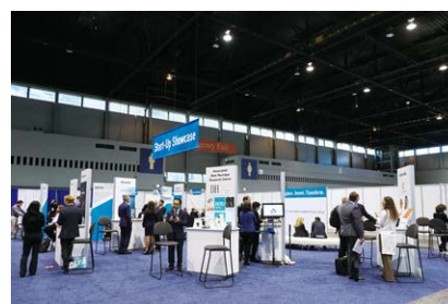
Technical Exhibitに設けられた Start-up Showcase