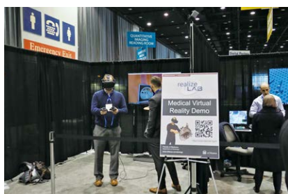
Virtual Reality Showcaseでの デモンストレーション

今回のプログラムは、7つのPlenary Sessionのほか、434テーマのEducational Courseが用意された。また、Scientific Paperは16分野で1712題が採択され、レイクサイドラーニングセンターでは、Education Exhibitが1812題、Scientific Posterが867題の展示・発表があった。11月29日(水)にはAnnouncement of Education Exhibit Awardsが行われ、Ehman大会長がMagna Cum Laudeの受賞者を発表した。日本からの発表(海外在住の日本人を含む)としては、神戸大学の森 俊